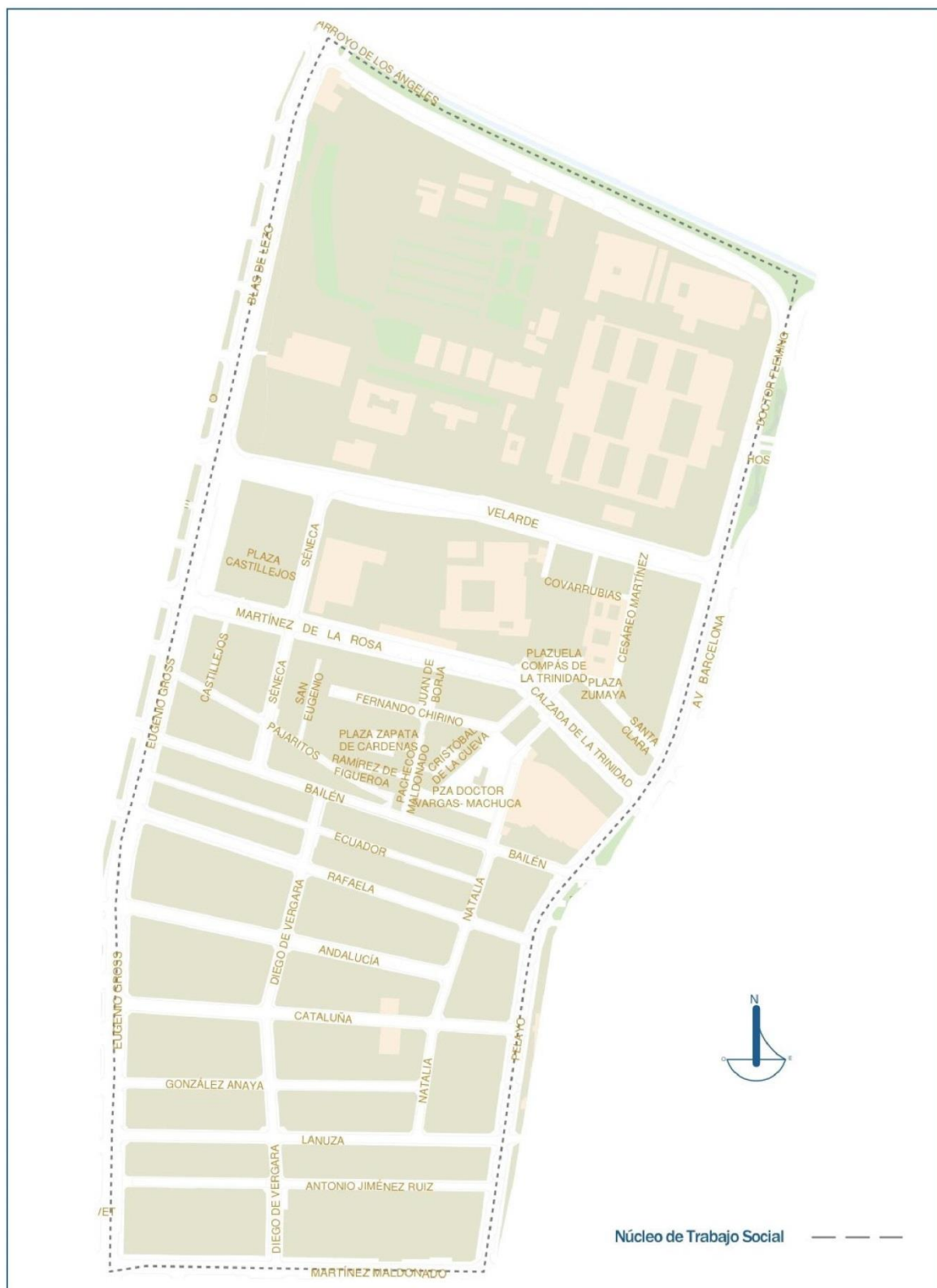
Núcleo de Trabajo Social — — — —

OBSERVATORIO MUNICIPAL PARA LA INCLUSIÓN SOCIAL